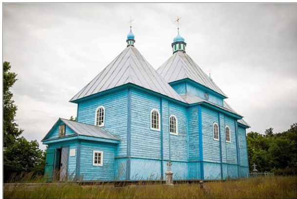
Адрес: г. Давид-Городок, ул. Октябрьская, 3

Построенная во второй половине XVII века мастерами Восточнополесской школы церковь - памятник деревянного зодчества.