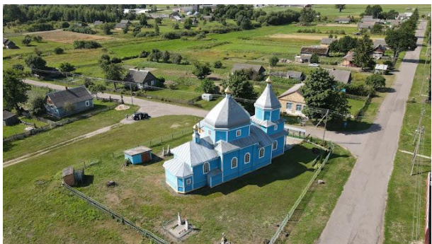
Адрес: д. Дубенец, ул. Юрчука, 12

О времени построения первой или древнейшей церкви в селе Дубенце предания не сохранилось. Неизвестно также о времени построения и настоящей приходской церкви, имеющей положение среди деревни, но основываясь на надписи, имеющейся на балке, отделяющей церковь от алтаря, можно постройку ее отнести к 1718 г.