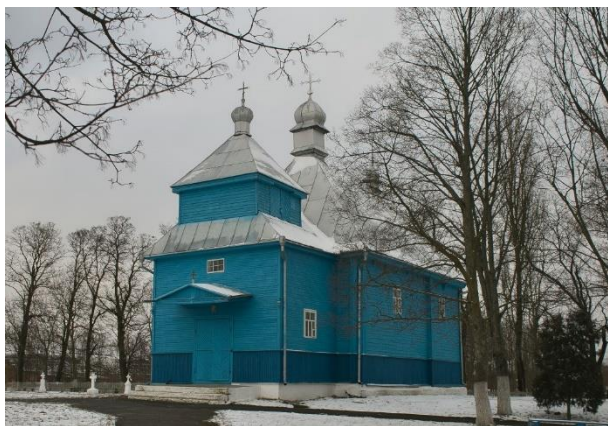
Адрес: д. Городная, пл. А. Климчука, 8

Церковь является памятником традиционного народного деревянного зодчества. История деревянного Свято-Троицкого храма берёт своё начало с так называемой Казацкой войны 1648-1651 годов. Сохранившаяся с того времени деревянная Свято-Троицкая в немного изменённом виде дошла до нашего времени. В XVIII веке церковь подверглась перестройке в связи с ветхим состоянием здания (1787 г.). Святыня деревни представляет собой памятник архитектуры местного традиционного полесского народного деревянного зодчества. При строительстве использовался приём, когда брёвна точно подгонялись одно к одному и закреплялись особым замком, что позволяло строить храм практически без единого гвоздя.